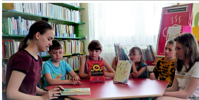
17 czerwca 2022 r. Spotkanie Dyskusyjnego Klubu Książki dla dzieci.