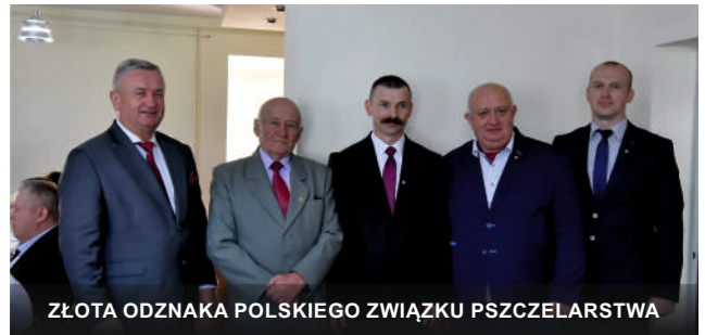
ZŁOTA ODZNAKA POLSKIEGO ZWIĄZKU PSZCZELARSTWA