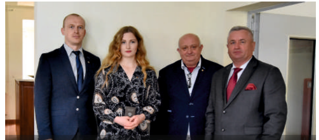
BRĄZOWA ODZNAKA POLSKIEGO ZWIĄZKU PSZCZELARSTWA

Gminne Koło Pszczelarzy powstało 09.12.2012 r. Wtedy to w miejscowości Wierchowiska Pierwsze odbyło się