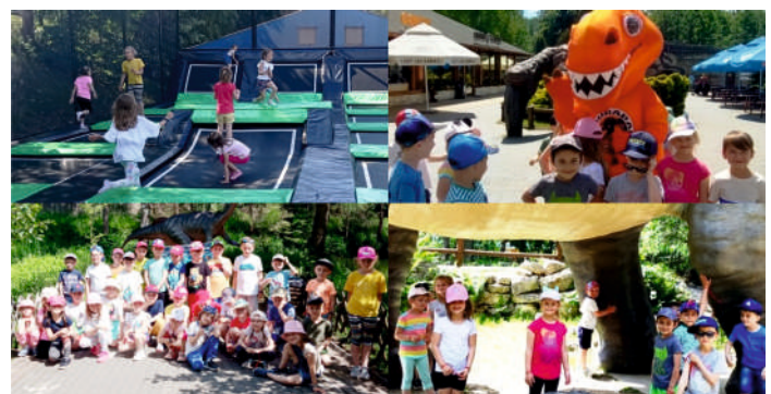
STARSZAKI W KRAJNIE DINOZAUROW

WSZYSTKIM DZIECIOM ŻYCZYMY UŚMIECHU I RADOŚCI SZCZĘŚCIA, ZDROWIA, POMYŚLNOŚCI.