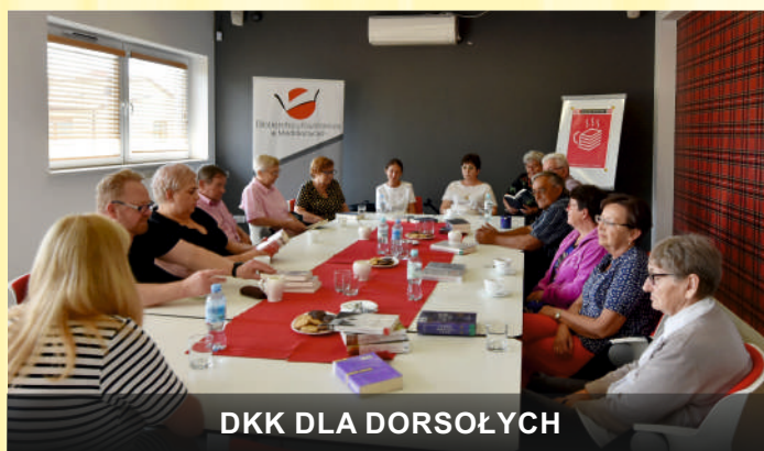
DKK DLA DORSOŁYCH