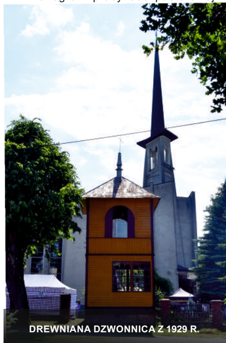
DREWNIANA DZWONNICA Z 1929 R.

Za ogrom pracy duszpasterskiej i gospodarczej włożonej