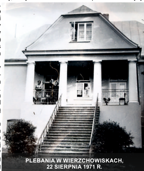
PLEBANIA W WIERCHOWISKACH, 22 SIERPNI 1971 R.

Witold Kowalik