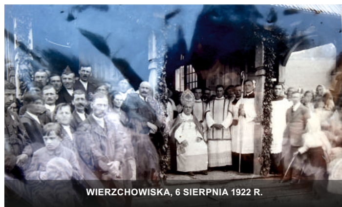
WIERCHOWISKA, 6 SIERPNI 1922 R.

Parafia posiada piękną, zadbaną świątynię i wspaniałych parafian. Następny wiek swojej działalności zaczyna w pełnych optymizmu perspektywach, chociaż i dzisiaj za naszą granicą toczy się wojna, oby jak najszybciej nastąpił pokój, oby nikt nie musiał ginąć za chore ambicje władców.