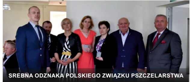
SREBNA ODZNAKA POLSKIEGO ZWIĄZKU PSZCZELARSTWA