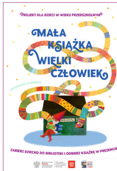
Kampania „Mała książka – wielki człowiek” to projekt realizowany przez Instytut Książki ze środków Ministerstwa Kultury i Dziedzictwa Narodowego.

Pamiętajcie, że miłość do czytania jest prezentem na całe życie!