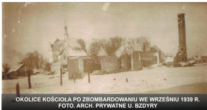
OKOLICE KOŚCIOŁA PO ZBOMBARDOWANIU WE WRZEŚNIU 1939 R.

83 lata temu, 8 września 1939 r., w piątek, nad gminą pojawiły się dwa niemieckie samoloty. Jeden z nich zrzucił bombę na park w Kolonii Zamek, a następnie dwie bomby na pole i park w Lutem. Eksplozja bomb nie spowodowała strat w ludziach. Drugi samolot zrzucił trzy bomby na Modliborzycy, które przyniosły już straty wśród ludności cywilnej, a także zniszczyły plebanie, w sąsiedztwie której śmierć poniosło kilku znajdujących się tam żołnierzy oraz Szkołę Powszechną.