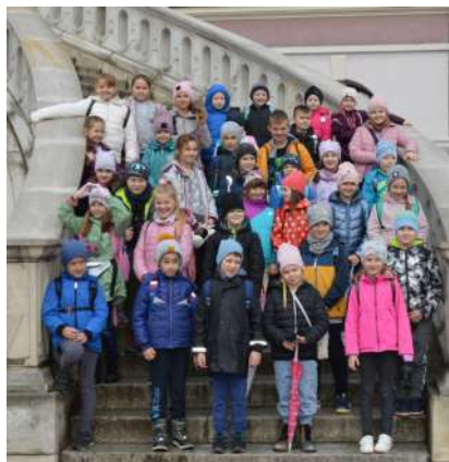
Klasy IV-VIII Publicznej Szkoły Podstawowej im. Jana Kochanowskiego w Wierzchowskich Drugich – dwudniowa wycieczka do Warszawy – 53 uczniów (dofinansowanie ze środków MEiN w wysokości 10.000 zł)