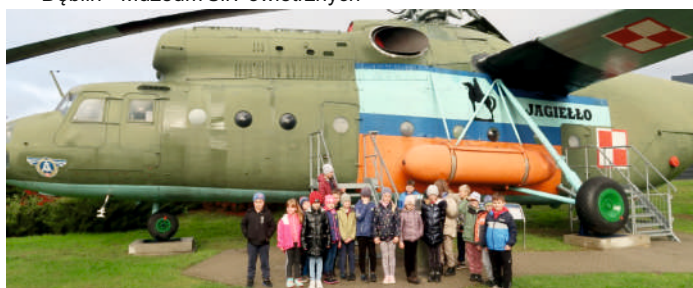
Klasy IV-VIII Publicznej Szkoły Podstawowej im. Jana Pawła II w Stożyszynie Pierwszym – dwudniowa wycieczka do Krakowa – 30 uczniów (dofinansowanie ze środków MEiN w wysokości 10.000 zł)