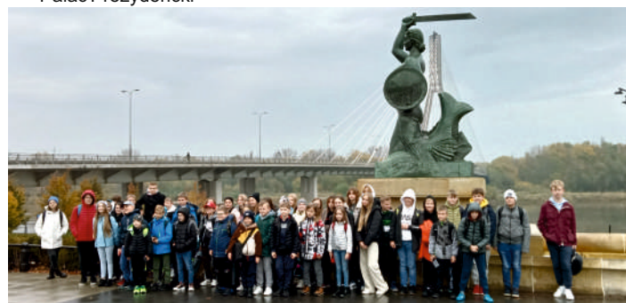
Klasy I-III Publicznej Szkoły Podstawowej im. Jana Pawła II w Stożyszynie Pierwszym – jednodniowa wycieczka do Dębina – 19 uczniów (dofinansowanie ze środków MEiN w wysokości 5.000 zł)