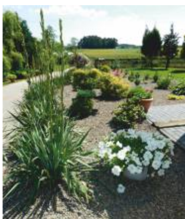
II MIEJSCE - STANISŁAW