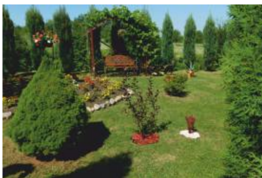
III MIEJSCE - TERESA PIECH