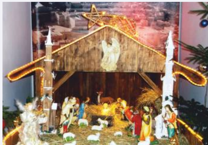
SZOPKA BOŻONARODZENIOWA Z KOŚCIOŁA PAR. W BRZEZINACH