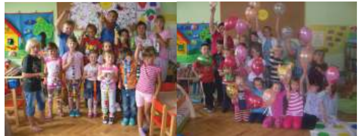
BALONOWE ZWIERZAKI - CUDAKI