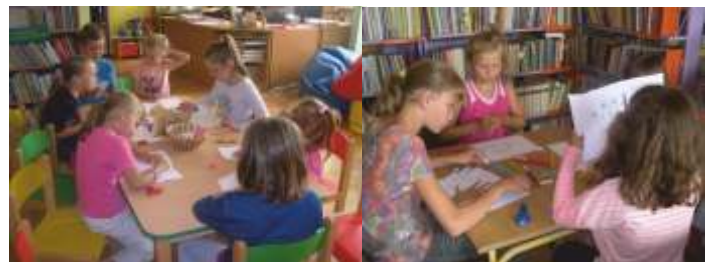
ROBIMY WAKACYJNE SŁONECZKO Z ODCISKÓW RĄCZEK