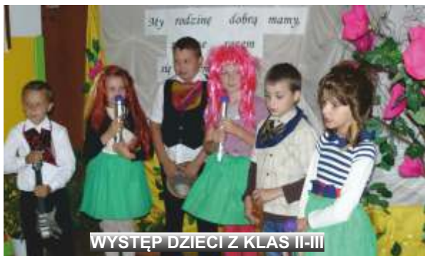
WYSTĘP DZIECI Z KLAS II-III

W niedzielne popołudnie 15 czerwca 2014 r. zorganizowany został w naszej szkole Dzień Rodziny. Na wstępie dzieci przedstawiły część artystyczną dla zebranych licznie członków rodzin.