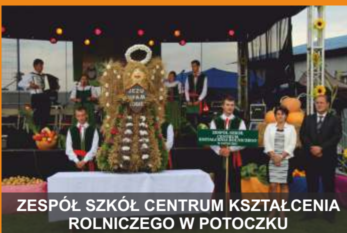
ZESPÓŁ SZKÓŁ CENTRUM KSZTAŁCENIA ROLNICZEGO W POTOCZKU