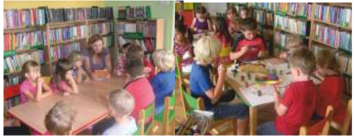
ROBIMY MAKARONOWĄ BIŻUTERIĘ