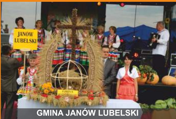
GMINA JANÓW LUBELSKI