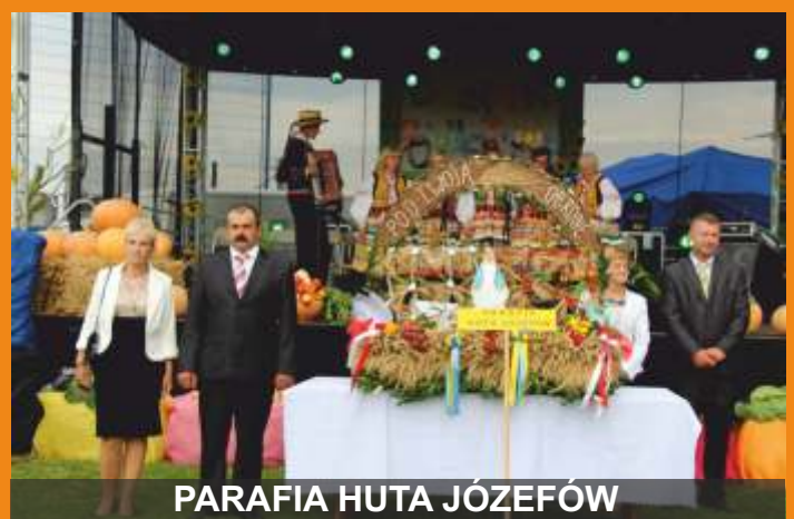
PARAFIA HUTA JÓZEFÓW