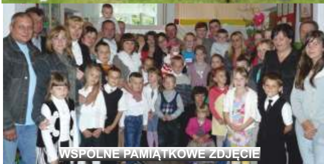
WSPÓLNE PAMIĄTKOWE ZDJĘCIE

23 czerwca 2014 r. wyjechaliśmy na wycieczkę autokarową do Bałtowa. Był to dzień pełen wrażeń: