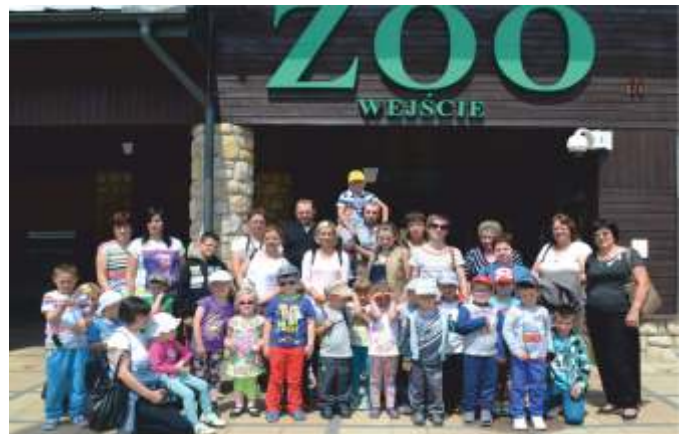
GRUPA NAJMŁODSZYCH PRZEDSZKOLAKÓW Z RODZICAMI I NAUCZYCIELKAMI