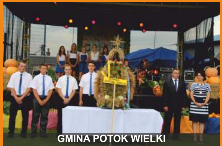
GMINA POTOK WIELKI