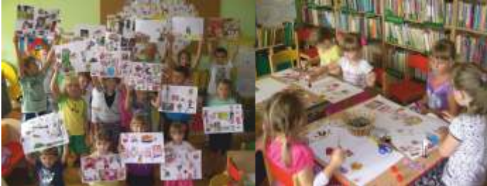
ROBIMY KOLAŻE Z GAZET