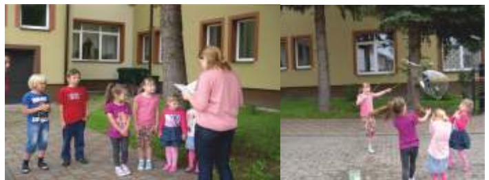
PUSZCZAMY WIELKIE BAŃKI MYDLANE