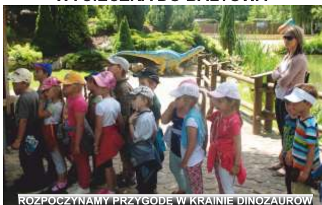
ROZPOCZYMYM PRZYGODĘ W KRAJNIE DINOZAUROW