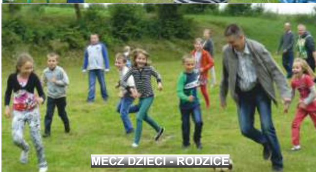
MECZ DZIECI - RODZICE