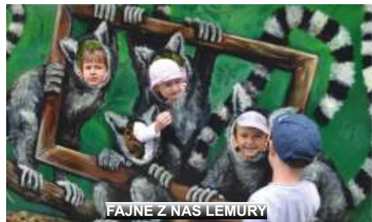
FAJNE Z NAS LEMURY