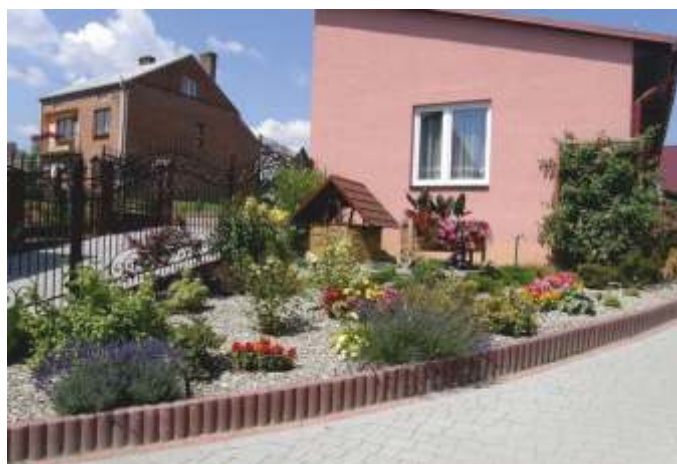
III MIEJSCE OGRÓD PANA JÓZEFA ZABIEGLIŃSKIEGO