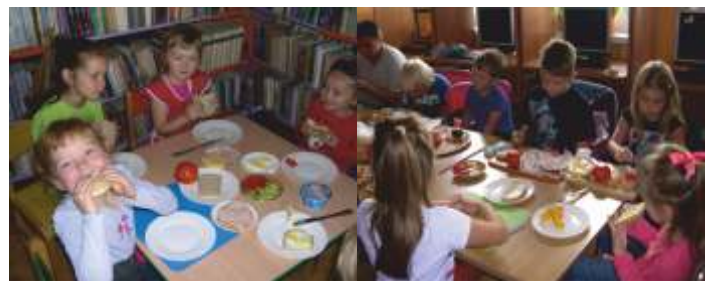
ZAKOŃCZENIE WAKACJI - ROBIMY KOLOROWE KANAPECZKI