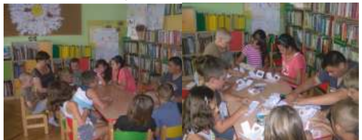
ROBIMY PAPIEROWE BUDKI DLA PTAKÓW