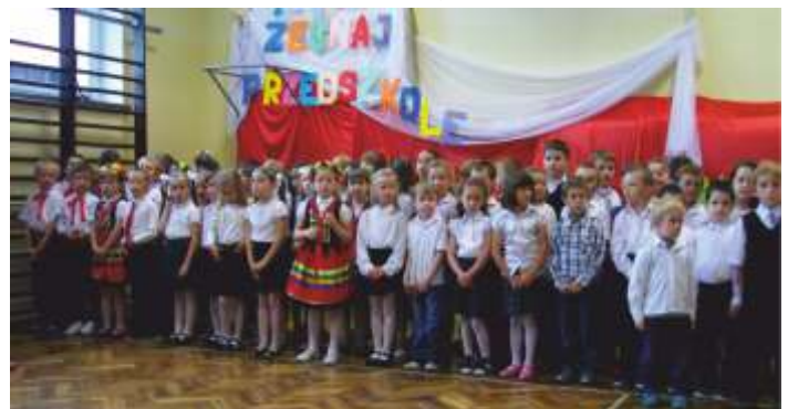
WSZYSTKIM WESOŁO, GDY CZYSTE POWIETRZE WOKOŁO - PRZEDSTAWIENIE W WYKONANIU PRZEDSZKOLAKÓW -