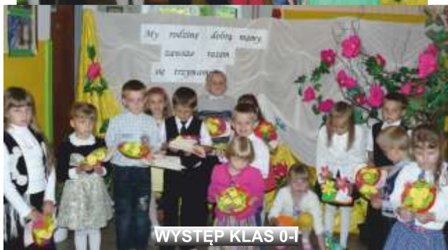
WYSTĘP KLAS 0-I

Następnie odbyły się różnorodne wspólne zabawy, malowanie kredą na placu szkolnym, a na zakończenie wspólny poczęstunek. Był to miłe i atrakcyjnie spędzony wspólnie wolny czas.