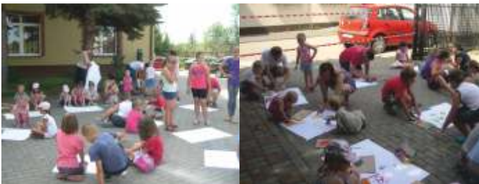
MALUJEMY FARBAMI BEZ UŻYCIA PĘDZELKÓW