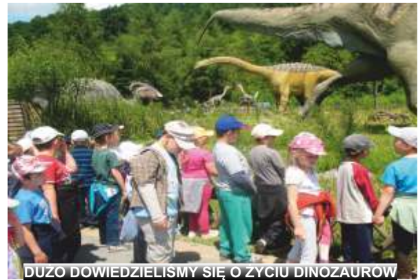
DUZO DOWIEDZIELISMY SIĘ O ŻYCIU DINOZAUROW