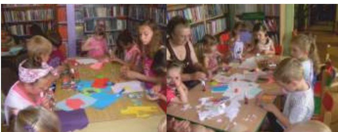
ROBIMY MOTYLKI Z DNA PLASTIKOWYCH BUTELEK