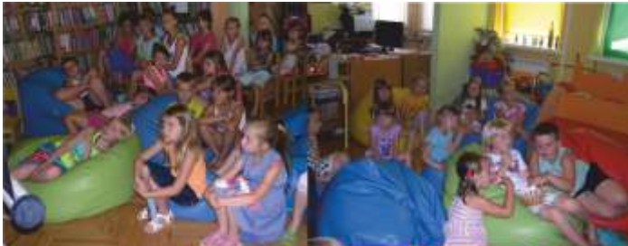
WAKACYJNE KINO W BIBLIOTECE