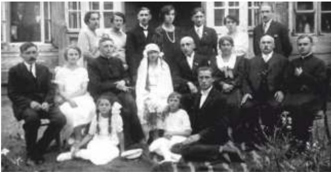
UROCZYSTOŚĆ ŚLUBNA W RODZINIE KSIĘDZA