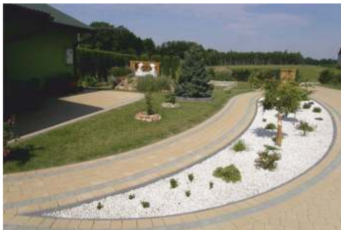
I MIEJSCE OGRÓD PANI MAŁGORZATY GRZEGÓRSKIEJ