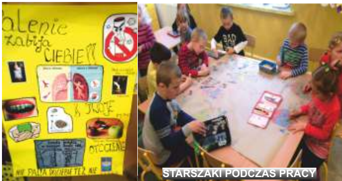
STARSZAKI PODCZAS PRACY