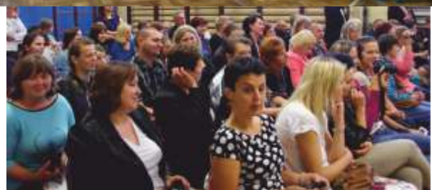
RODZICOM PODOBAŁ SIĘ WYSTĘP DZIECI