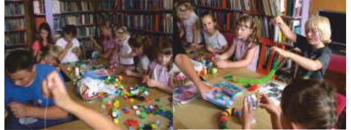
WĘŻE Z PLASTIKOWYCH KORKÓW