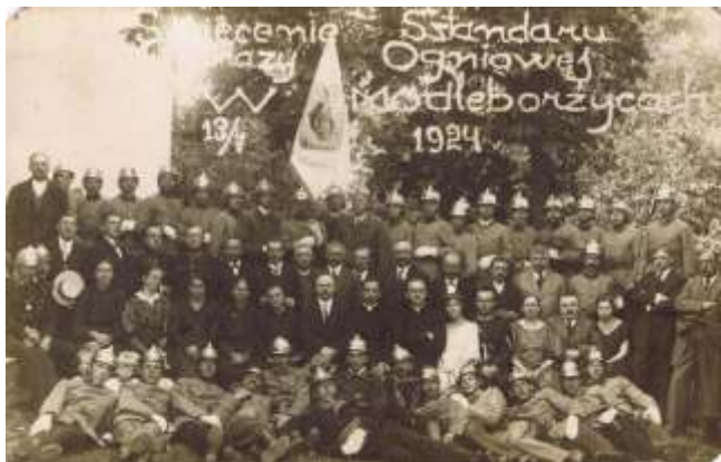
POŚWIĘCENIE SZTANDARU STRAŻY OGNIOWEJ 1924 R.