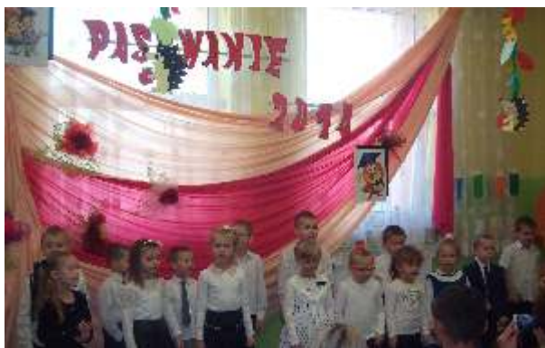
Występ Starszaków na pasowaniu