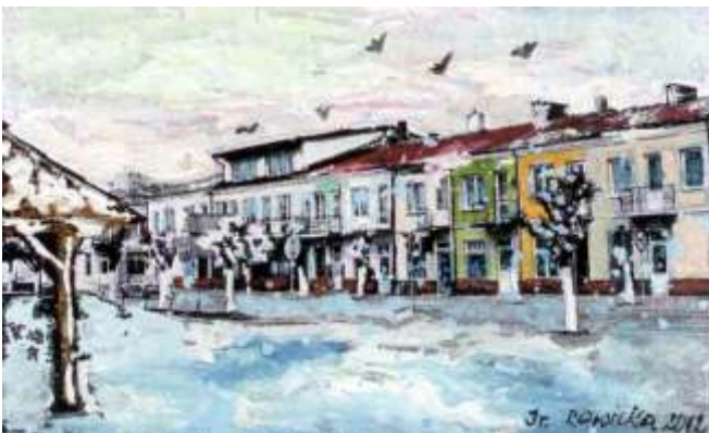
ULICA ARMII KRAJOWEJ W MODLIBORZYCACH W ZIMOWEJ SZACIE - AKWARELA