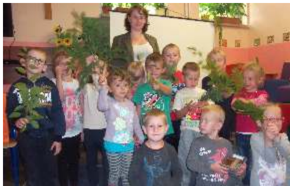
Spotkanie z panią Leśniczy.