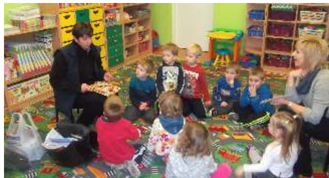
Spotkanie z panią Listonosz.