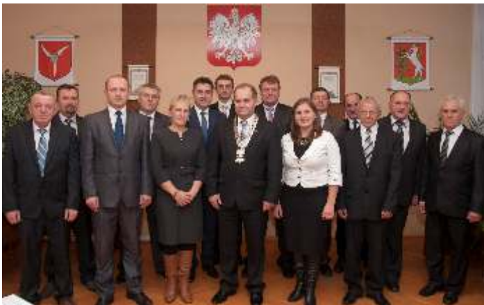
Radni VII kadencji