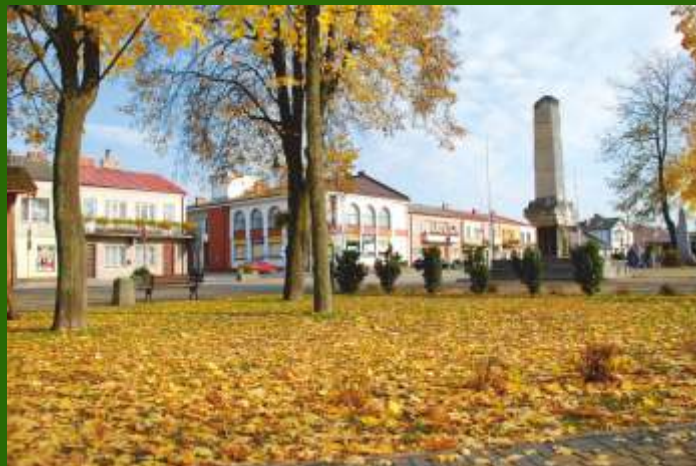
FOT. RAFAŁ FRĄCZEK