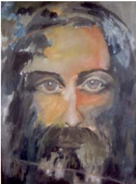
„CHRYSZTUS” - INSPIRACJA CAŁUNEM TURYŃSKIM MALARSTWO OLEJNE NA PŁÓTNIE