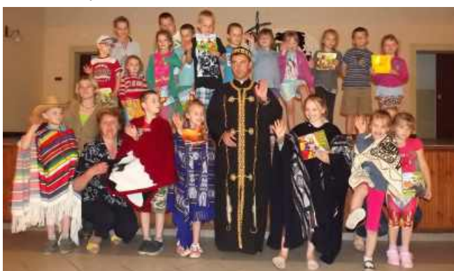
W STROJACH MISYJNYCH