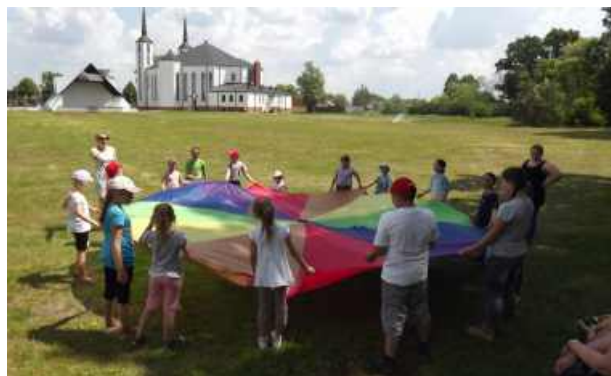
GRY I ZABAWY NA ŚWIEŻYM POWIETRZU