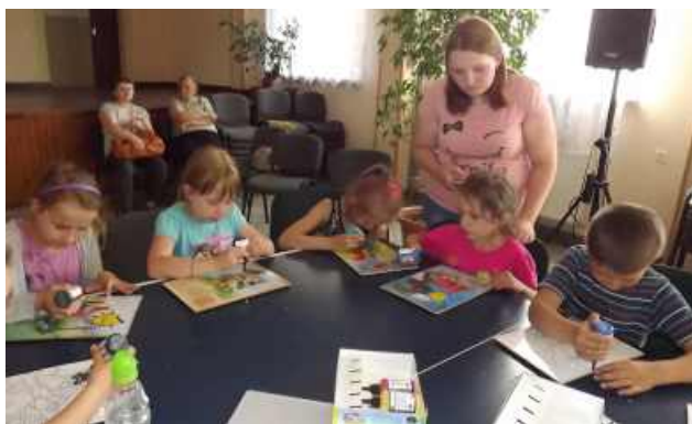
ZAJĘCIA PLASTYCZNE – MALOWANIE NA SZKLE