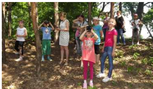
OBSERWACJA PRZYRODY PRZY UŻYCIU LORNETEK