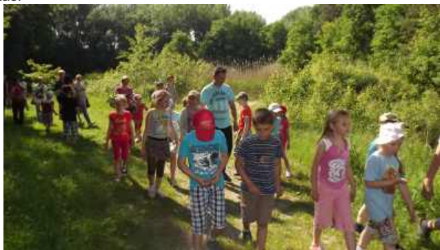
ZWIEDZANIE OKOLIC RADOMYŚLA

1 czerwca 2015r. wyjechaliśmy na dwudniową wycieczkę do Radomyśla nad Sanem. Był to wyjazd integracyjny, gdyż oprócz wychowawców z każdym dzieckiem pojechali członkowie jego rodziny – mama, starsze rodzeństwo lub babcia. Pobyt był wypełniony różnymi atrakcjami: zajęcia warsztatowe o działalności misji na świecie, zajęcia plastyczne – malowanie na szkle, zajęcia przyrodniczo- ekologiczne w formie gier i zabaw, zajęcia ruchowe na placu zabaw, wycieczki po okolicy, zajęcia integracyjne w formie zabawy – zajęcia taneczne oraz spotkanie przy grillu. Dzieci z zaciekawieniem oglądały również interesujące filmy przyrodnicze w 3D. Koszty tej wycieczki w większości zostały pokryte ze sprzedaży makulatury i z kolędowania - wystawienie Jasełek w miejscowej kaplicy. Był to bardzo aktywnie i przyjemnie spędzony czas.