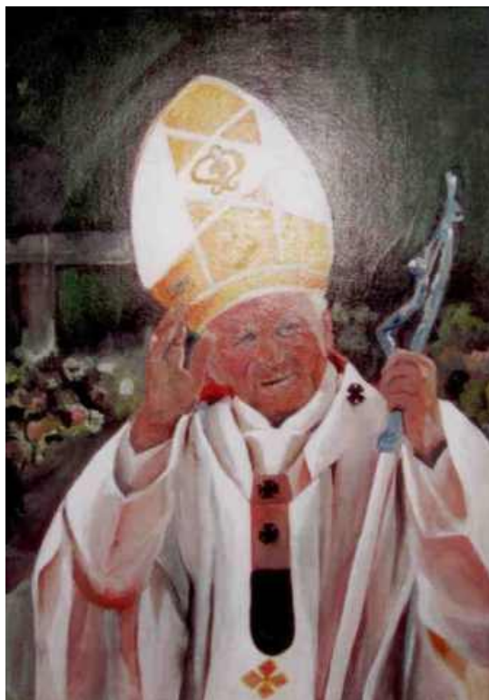
PAPIEŻ - OBRAZ OLEJNY