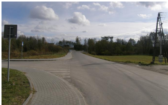
Przebudowa drogi powiatowej Stojeszyn Drugi - Zarajec