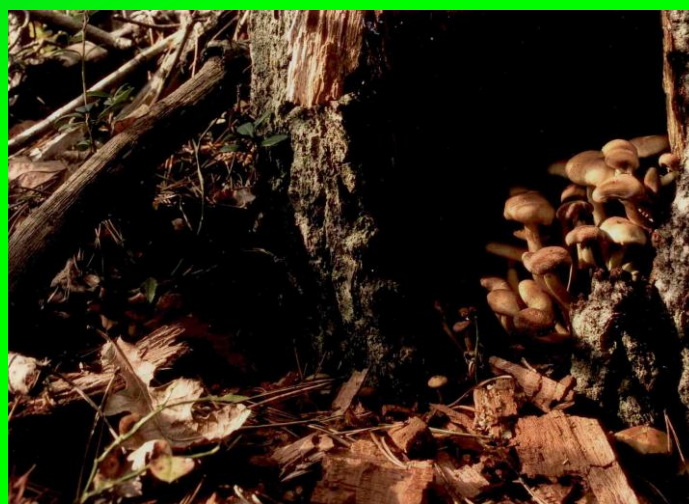
III miejsce - Mateusz Trójczak