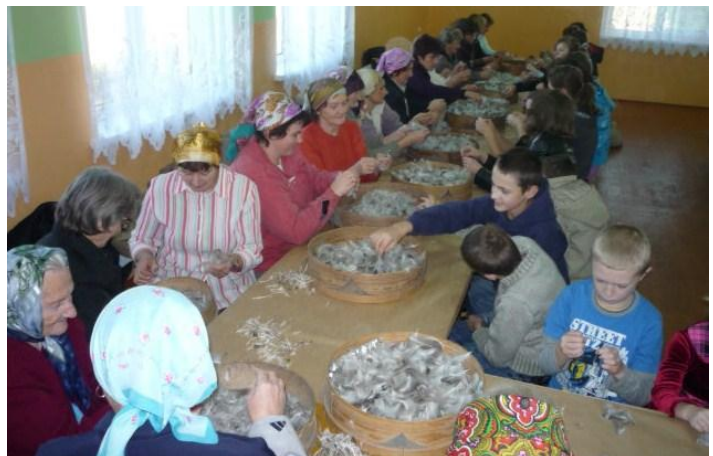
Spotkanie „Pierzaczkowe” w świetlicy w Wolicy Pierwszej