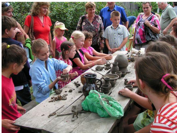
W Łązku Garncarskim