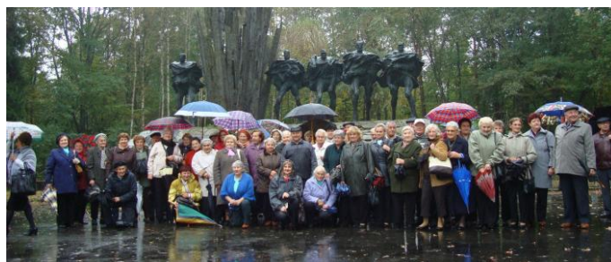
Seniorzy z Łazisk i Modliborzyc na Porytowych Wzgórzach