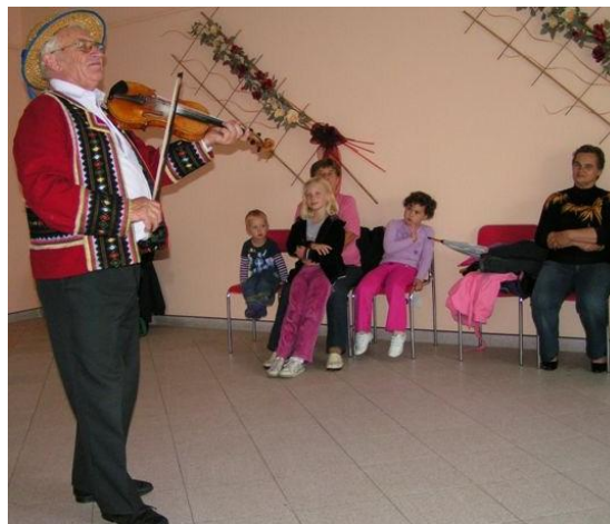
Prezentacja gry na skrzypcach

30 września w świetlicy obok Urzędu Gminy nastąpiło uroczyste zakończenie i podsumowanie projektu