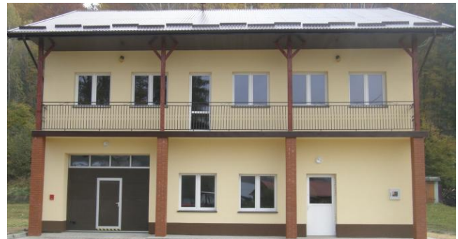
Wyremontowana remiza OSP

To był jeden z tych dni, o których pamięta i mówi się długo po nim. To był ważny dzień dla lokalnej społeczności, wielu strażaków i ich rodzin. Uroczystość ta i otrzymane wyróżnienia są podziękowaniem i wypływają z wdzięczności społeczeństwa za tradycję, wierność, honor i męstwo, za najwyższy trud i poświęcenie strażaków w obronie naszego życia i mienia.