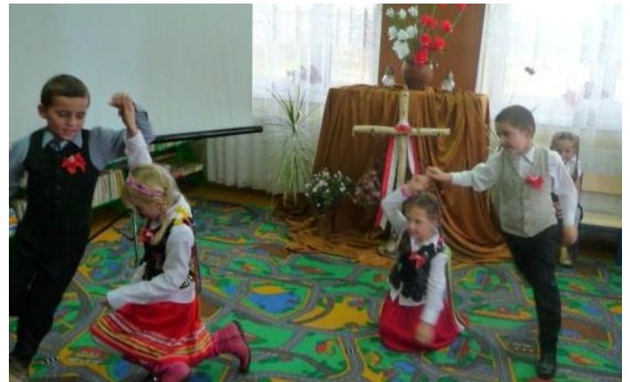
Dzieci tańczące krakowiacka

Tymi słowami dzieci rozpoczęły uroczysty montaż słowno-muzyczny „Ojczyzna w sercach się zaczyna” z okazji Narodowego Święta Niepodległości. Występ odbył się 10 listopada 2010 roku w Filii Bibliotecznej w Stojeszynie Pierwszym. Dzieci złożyły hołd wszystkim walczącym o niepodległość Ojczyzny. Zaprezentowały wiersze oraz piosenki i taniec. Hymn Polski zaśpiewany przez dzieci wprowadził wszystkich w podniosły nastrój. Była to z pewnością ważna lekcja patriotyzmu.