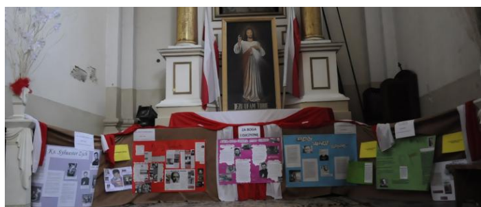
Wystawa poświęcona zamordowanym kapłanom