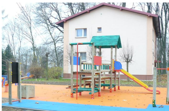
Plac zabaw przy Zespole Szkół w Wierzchowiskach Drugich