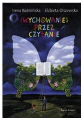
Dar na całe życie

Jeśli naprawdę chcesz, by Twemu dziecku nauka przychodziła łatwiej, by wzniosło się ponad przeciętność, było inteligentne i szczęśliwe, zaszczep w nim miłość do książek. Czytanie, przekonują autorki, to najskuteczniejszy i najtańszy sposób na dobre wychowanie!