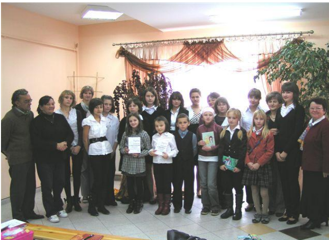
Młodzi recytatorzy wraz z komisją i nauczycielami