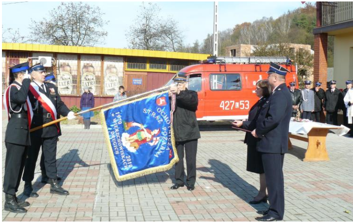
Odnaczenie Brązowym Medalem Za Zasługi Dla Pożarnictwa