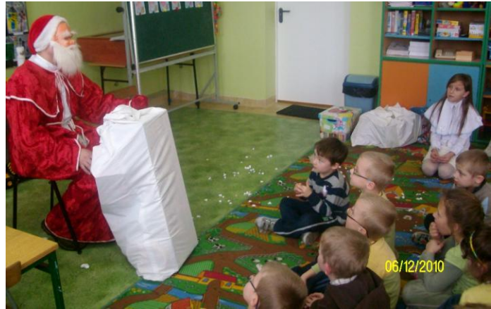
Dzieci z zaciekawieniem słuchały Mikołaja