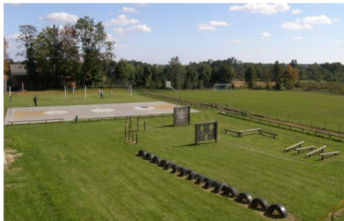
Kompleks boisk sportowo - rekreacyjnych w Stojeszynie Pierwszym