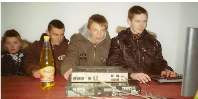
Andrzejki na Słupiu dj „Helmer” z kolegami