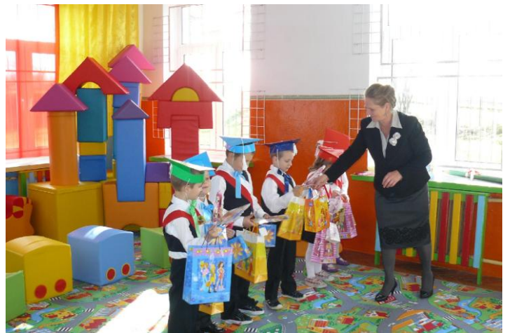
Upominki od pani Dyrektor