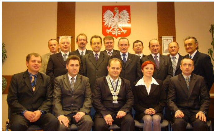
Radni VI kadencji