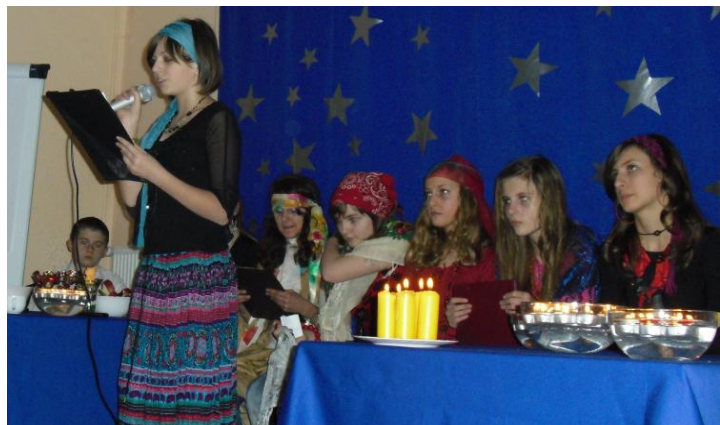
Młodzież podczas występu andrzejkowego