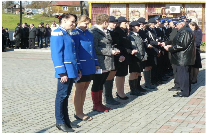
Wręczenie odznaczeń "Wzorowy Strażak"