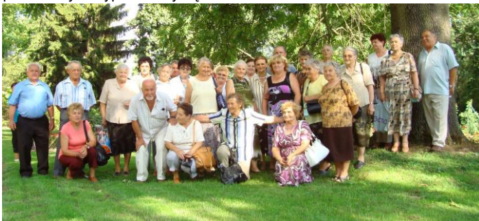
Pamiętkowe zdjęcie w Ogródku Botanicznym w Lublinie

Przez ostatnie miesiące, a właściwie przez cały bieżący rok Klub Seniora był wyjątkowo aktywny. Część działalności już opisywaliśmy w „Wieściach Gminnych” od czerwca jednak wiele się wydarzyło. Tym razem postanowiliśmy rozejrzeć się po regionie, by sprawdzić powiedzenie: „ Cudze chwalcie swego nie znacie ”. Wybraliśmy się do Zamku w Lublinie, by zwiedzić piękno wnętrza i poznać jego historię. Najbardziej podobala się sztuka ludowa regionu lubelskiego oraz sztuka zdobnicza. W pamięci naszej zostanie też Kaplica Trójcy Świętej wraz ze swoim tajemniczym klimatem. Pełna niezapomnianych wrażeń była wędrowka z pochodniami przez podziemia Lublina, od lochów Trybunału Koronnego począwszy. Była to swoistego rodzaju podróż przez historię miasta. Będąc w takim miejscu nie mogliśmy ominąć Archikatedry Lubelskiej. Najważniejsza była dla nas modlitwa, podziękowania i prośby zawieszane Matce Bożej, ale mieliśmy też okazję obejrzeć zakrytą słynną w całym kraju z akustyki oraz skarbiec i krypty. Nieco innym, ale również wzbudzającym miłe emocje, okazał się Ogród Botaniczny oraz Muzeum Wsi Lubelskiej. Lublin ma jeszcze wiele ciekawych miejsc, ale te już znamy. Pozostało nam Muzeum na Majdanku. Czy tam pojeździć? Raczej nie i choć pamięć tej historii jest szczególnie dla nas ważna, to wolimy nie wracać do najsłabszych chwil naszego życia. W swoich wędrowkach poznawczych wypuściliśmy się także do Zamku w Kozłowie za Lublinem.