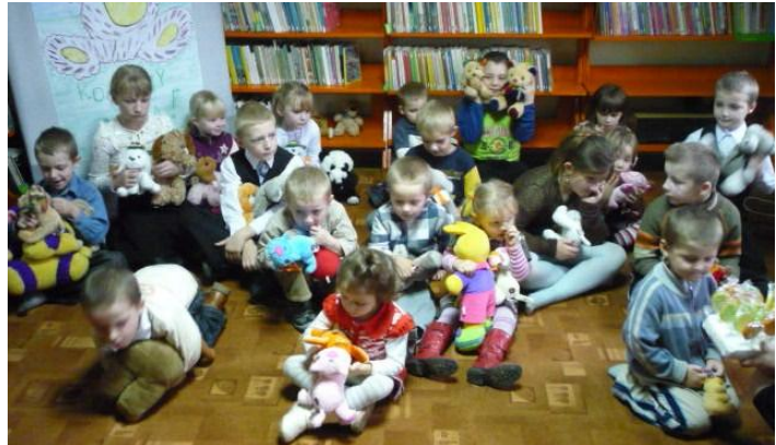
Dzieci ze swoimi ulubionymi misiami