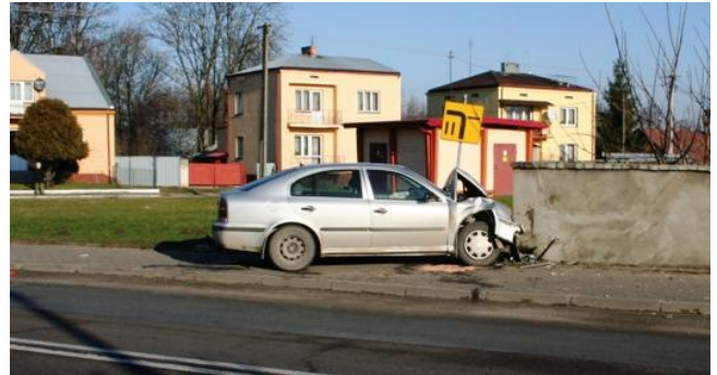
Wypadek w Modliborzycach na krajowej 19