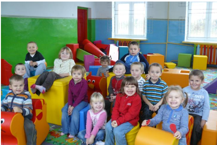
Przedшкоlaki w sali zabaw