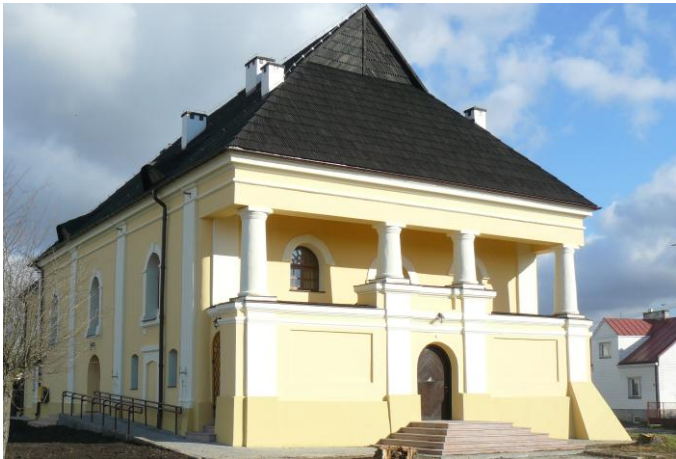
Wyremontowany budynek GOK