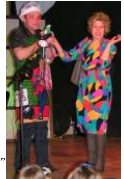
KABARET „NA CHWILĘ”

Tegoroczny dwugodzinny koncert z okazji Dnia Kobiet, organizowany 11 marca, kierowany był również do panów, z racji mniej popularnego, przypadającego na 10 marca Dnia Matki. Na scenie GOK-u występiły soliści, zespoły taneczne, kabaret z Wierchowisk „Na chwilę”, zespół Klubu Seniora oraz kapela „Sanna”. Były wiersze i teksty o kobietach, matkach i niełatwych relacjach damsko-męskich.