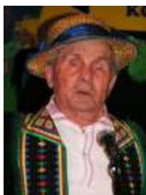
STANISŁAW FIJAŁKOWSKI 1928-2012