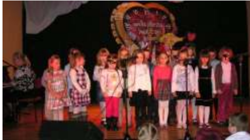
PRZEDSZKOLAKI Z MODLIBORZYC

Na scenie GOK-u od godz. 15-tej przez ponad 5 godzin trwały występy artystyczne. Występiły soliści i zespoły wokalne, grupy taneczne, przedszkolaki z Modliborzyc i Wierchowisk, uczniowie szkoły muzycznej z Modliborzyc, nasza orkiestra dęta z Wierchowisk oraz zespół Black Way. Były chwile, gdy na sali brakowało nawet miejsc stojących. Serdeczne podziękowania dla darczyńców, wolontariuszek, artystów i widzów, a tym samym - wszystkim grającym tego dnia w Wielkiej Orkiestrze w Tecznej Pomocy.