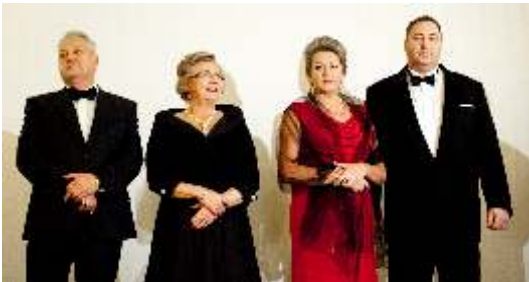
PREZESI ZPM „MATTHIAS” Z MAŁŻONKAMI

Przez szereg lat za jakość produkowanych wędlin zakład otrzymał wiele wyróżnień, nagród i pucharów m.in. Ministra Rolnictwa, władz samorządowych i wojewódzkich oraz specjalistów branży mięsnej i Klubu Szeffów Kuchni. Potwierdzeniem tego są choćby nagrody zdobyte w tym jubileuszowym roku i sklasyfikowanie wyrobów firmy jako produktów najwyższej jakości w przemyśle mięsnym. W wiosennej i jesiennej edycji konkursu na szczególną uwagę komisji zasłużyły sobie dania gotowe „Gulasz wołowy” i „Bigos wiejski zapiekany” oraz „Karczek z lubelskiej zagrody”, który uznano za najlepszy produkt wytwarzany metodami tradycyjnymi.