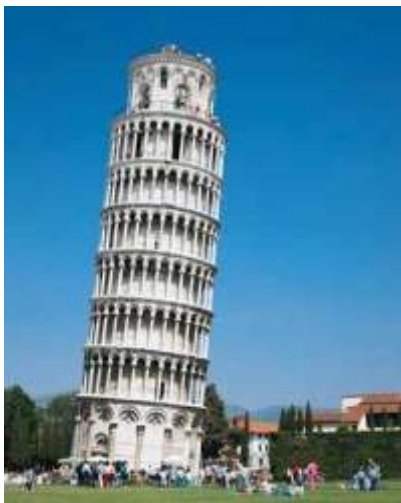
SŁYNNNA KRZYWA WIEŻA W PIZIE

Niektórzy porównują ją z Krzywą Wieżą w Pizie. Piza leży w północno-zachodniej części Włoch nad Morzem Tyrreńskim w odległości 80 km od Florencji.