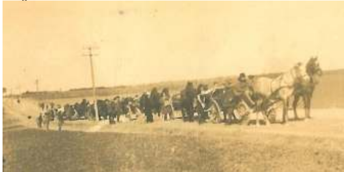
TRANSPORT CIAŁ PO EKSHUMACJI