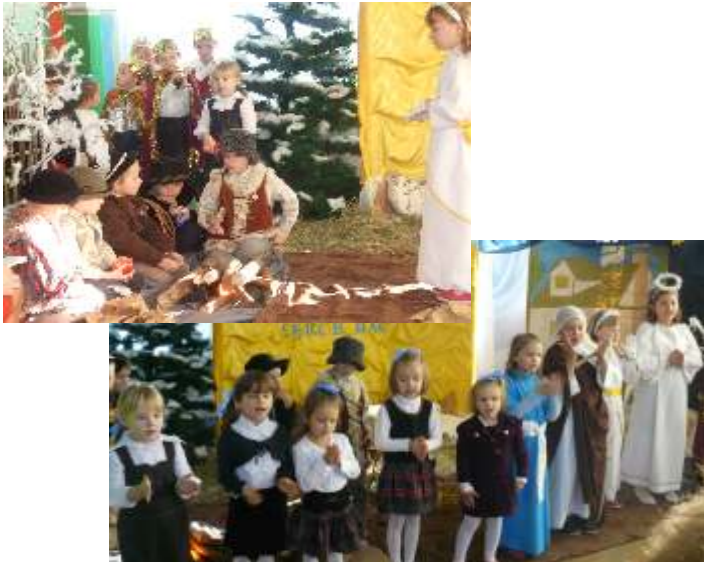
Z WIZYTĄ NA POCZCIE

16 grudnia 2011 roku odbyły się w naszej szkole jasełka. Dzieci, wcielając się w różne postacie, przedstawiły cud Bożego Narodzenia w Betlejem.