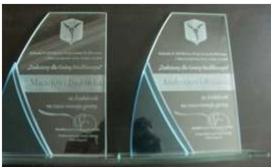
STATUETKA „ZASŁUŻONY DLA GMINY MODLIBORZYCE”