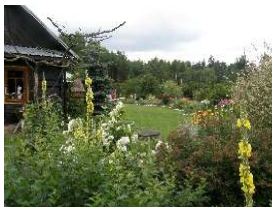
Najpiękniejszy ogród 2011 roku - Pani Elbieta Kochańska

O terminie wręczenia nagród uczestnicy konkursu zostaną powiadomieni telefonicznie.