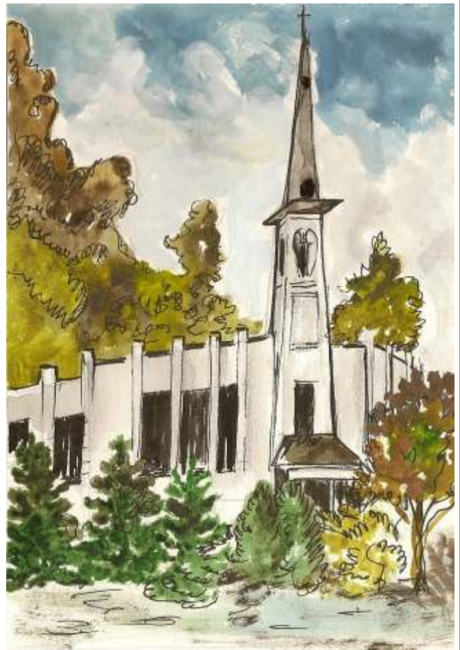
"KOŚCIÓŁ W WIERZCHOWISKACH" IRENA ROWICKA TECH. MIESZANA