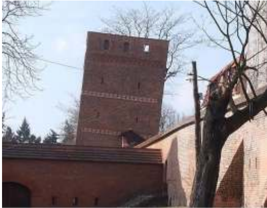
KRZYWA WIEŻA W TORUNIU

Pomimo przechyłu próbowano wykorzystać budowlę. Wyrównano więc stropy i wprowadzono uskokowy mur szachulcowy. W XIX wieku była tu kuźnia forteczna. Toruńska Krzywa Wieża jest obecnie atrakcją miasta. Ogląda ją i podziwia chyba każdy turysta!