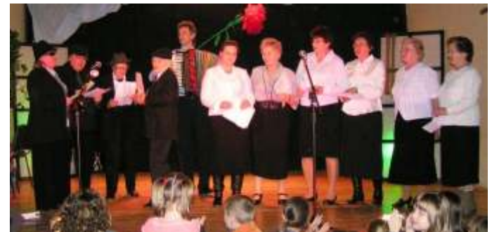
ZESPÓŁ KLUBU SENIORA