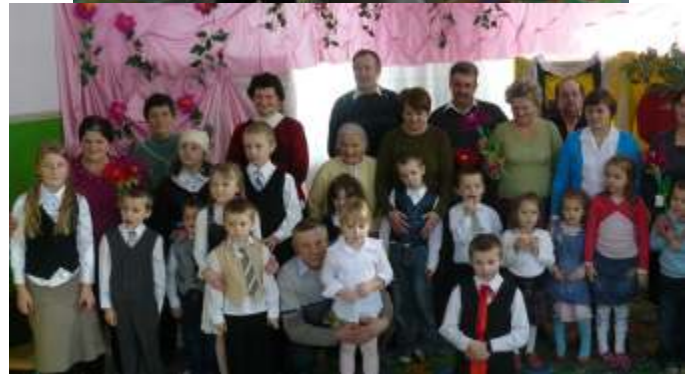
CHOINKA W SZKOLE