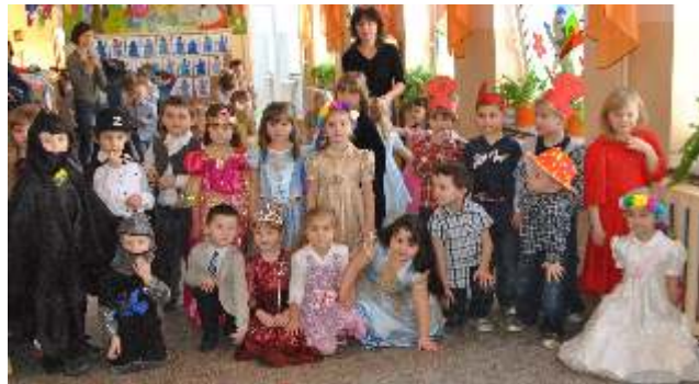
Nauczycielki Samorz dowego Przedszkola w Modliborzycach

Okres wi t i karnawału przedszkolaki zako czyły bałem przebiera ców.