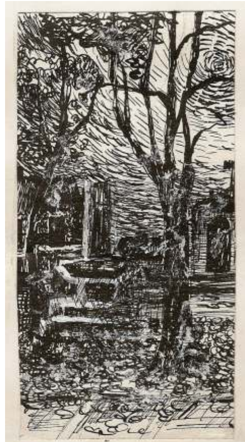
"WIETRZNIĘ" rys. piórkami IRENA ROWICKA