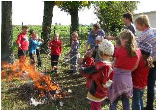
SPOTKANIE PRZY OGNISKU