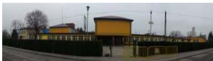
ZESPÓŁ SZKÓŁ W MODLIBORZYCACH

Kwota dotacji otrzymana z NFOŚiGW w 2012 roku – 446 600,00 zł Kwota pożyczki otrzymana z NFOŚiGW w 2012 roku – 281 880,00 zł