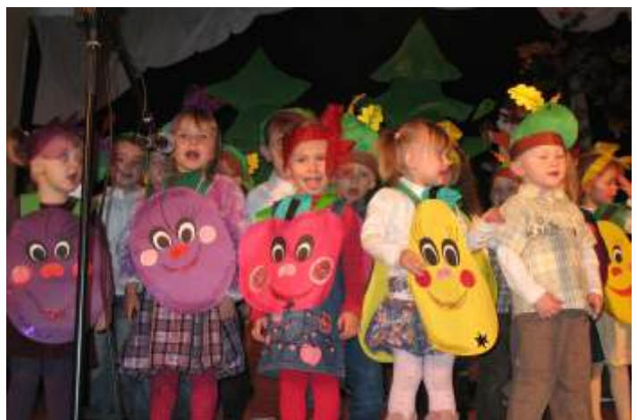
MALUCHY PANI DOROTY PIKULI