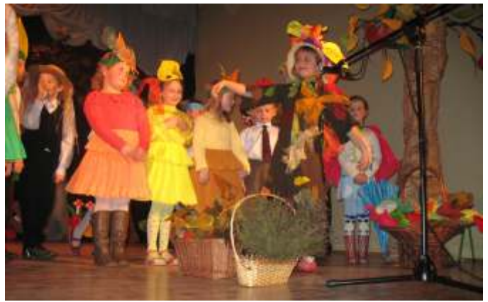
6 - LATKI PANI ELŻBIETY CZERWONKI

Nadeszła jesień i nadszedł czas na pierwsze występy dzieci z Samorządowego Przedszkola w Modliborzycach. Każda z grup ciężko pracowała, aby wypaść na scenie jak najlepiej. Dla większości był to pierwszy kontakt ze sceną i tak liczną publicznością. Dzieci pięknie recytowały, pięknie śpiewały i pięknie tańczyły, wzruszając serca swoich najbliższych. Bajkowa dekoracja, kolorowe stroje i uśmiechy na twarzach przedszkolaków sprawiły, że i dla dzieci i dla dorosłych „Jesienny Koncert” stał się naprawdę dużym wydarzeniem i niezapomnianym przeżyciem estetycznym.