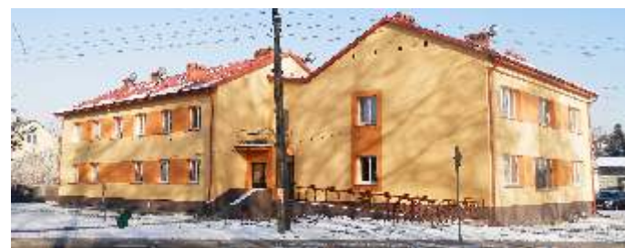
OŚRODEK ZDROWIA W MODLIBORZYCACH