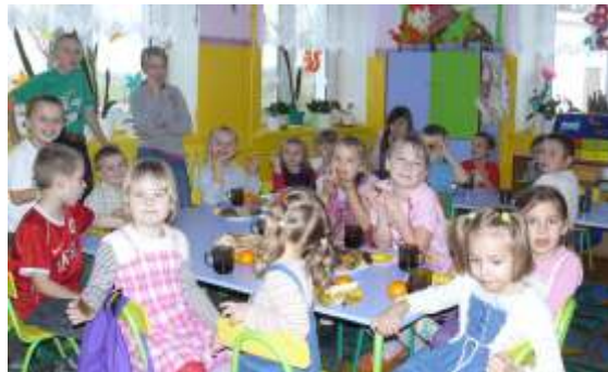
ZABAWA ANDRZEJKOWA POŁĄCZONA Z WRÓŻBAMI