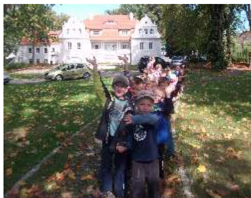
...park i okolice