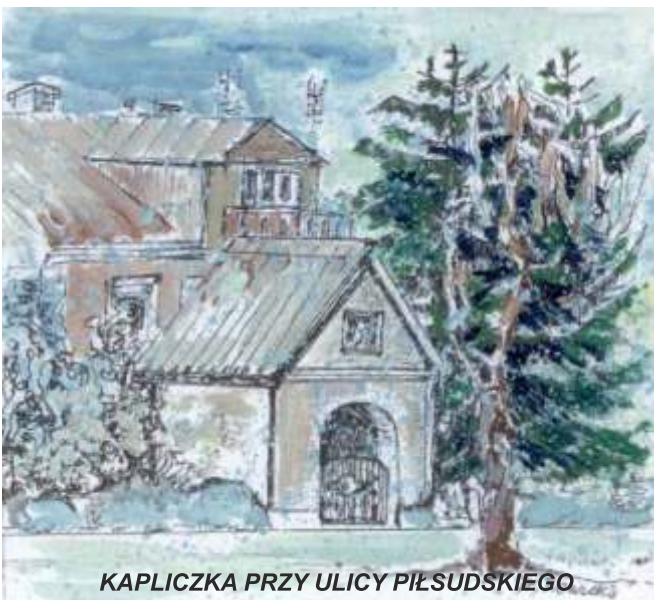
KAPLICZKA PRZY ULICY PIŁSUDSKIEGO W MODLIBORZYCACH ZIMĄ