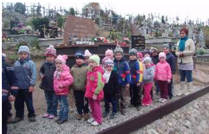
...pomniki Pamięci Narodowej i pamiętamy o grobie Nieznanego Żołnierza

Pasowanie na przedszkolaka, to pierwsza z wielu przedszkolnych uroczystości, która miała miejsce 6 listopada 2012 roku, w Samorządowym Przedszkolu w Wierzchowiskach.