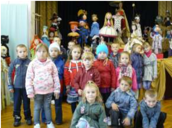
PASOWANIE KLASY I

Najpierw byliśmy na przedstawieniu „Przygody żeglarza Sindbada”. Później odwiedziliśmy muzeum, w którym obejrzelśmy wystawę lalek, kukiełek z różnych przedstawień Teatru Lalki. Następnie uczestniczyliśmy w zajęciach edukacyjnych i uczyliśmy się wykonywać samodzielnie różne kukielki.