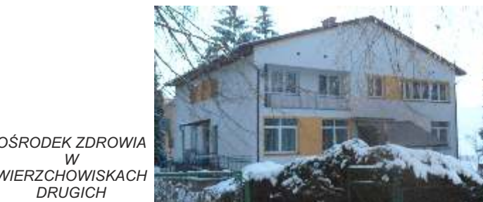
OŚRODEK ZDROWIA W WIERCHOWISKACH DRUGICH