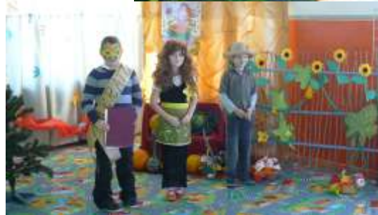
WYSTĘP KLAS II - III