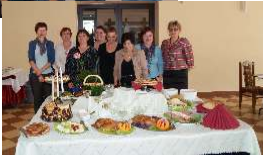
„Kucharz małej gastronomii” (5 kobiet).

Ponadto w ramach w/w projektu grupa 11 kobiet uczestniczyła w Programie Aktywności Lokalnej (PAL- u) i otrzymała wsparcie w postaci bezpłatnego poradnictwa psychologicznego, prawnego, warsztatów psychoedukacyjnych, a także niezmiernie ważnych, w dzisiejszej dobie bezrobocia, warsztatów z poruszania się po rynku pracy i autoprezentacji. Mając na uwadze potrzebę budowania relacji rodzinnych, sztukę wspólnej relaksacji zorganizowano wyjazd matek z dziećmi do Nałęczowa, a wspólnie spędzony czas przyczynił się nie tylko do wzmocnienia więzi rodzinnych, ale także uwrażliwił na potrzeby drugiej osoby. Innowacyjnym działaniem na naszym terenie były metamorfozy uczestników PAL-u, dzięki którym panie mogły zmienić swój wizerunek i umocnić wiarę w własną wartość.