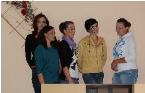
„Wizaż i stylizacja paznokci” (5 kobiet)

Osoby uczestniczące w projekcie przede wszystkim zdobyły nowe doświadczenie i kwalifikacje zawodowe poprzez ukończenie następujących kursów: