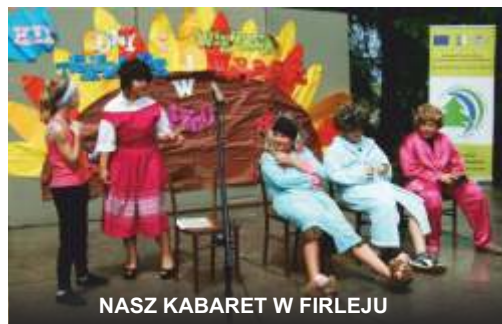
NASZ KABARET W FIRLEJU