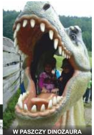
W PASZCZY DINOZAURA

Natomiast w Zamościu pogoda nam dopisała. Po posiłku w Mac Donaldzie i wesołej zabawie na zjeździe wyruszyliśmy do zwiedzania ZOO, aby poszerzyć naszą wiedzę przyrodniczą.