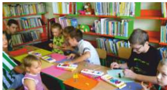
LUDZIKI Z PLASTELINY