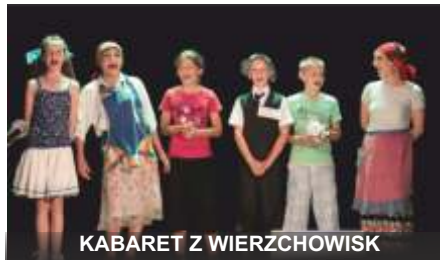
KABARET Z WIERZCHOWISK

9 czerwca 2013 r., z okazji minionych Dnia Matki i Dnia Dziecka oraz nadchodzącego Dnia Ojca zorganizowaliśmy koncert. Na scenie wystąpili nasi soliści, grupy kabaretowe oraz zespoły taneczne, działające pod opieką naszych instruktorów w GOKu i świetlicy w Wierzchowiskach.