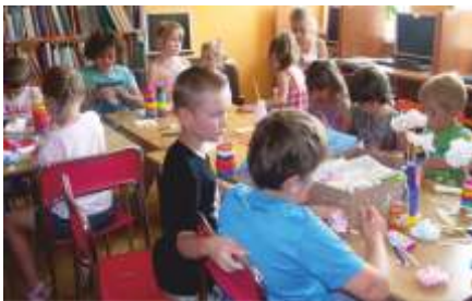
ROBIMY GOŹDZIKI Z CHUSTECZEK HIGIENICZNYCH

Największym powodzeniem wśród dzieci cieszył się cykl zajęć plastycznych pod hasłem „Malowanki biblioteczne”. Podczas czwartkowych spotkań w bibliotece stworzyliśmy m.in.: „Teksturew ludki” wykorzystując do tego: stare pudełka, papier kolorowy, niepotrzebne guziki,