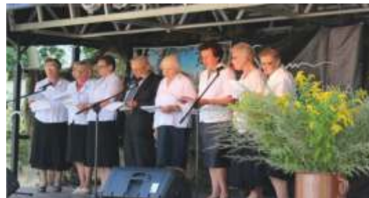
ZESPÓŁ KLUBU SENIORA