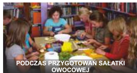
PODCZAS PRZYGOTOWAŃ SAŁATKI OWOCOWEJ

Wszystkie proponowane przez bibliotekę formy spędzenia wolnego czasu cieszyły się dużym zainteresowaniem, zwłaszcza że tylko biblioteka zorganizowała wakacyjne zajęcia dla dzieci.