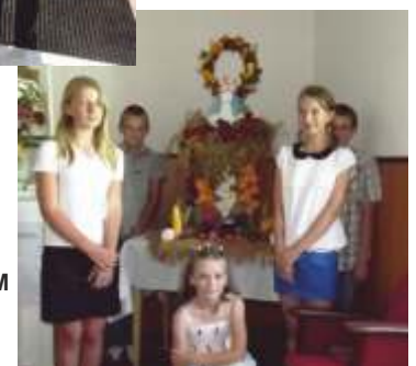
MŁODZIEŻ Z WIENCEM DOŻYNKOWYM