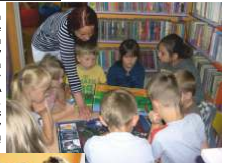
ZAJĘCIA EDUKACYJNE PROWADZONE PRZEZ PANIE Z LODR W JANOWIE LUBELSKIM

edukacyjnych zorganizowanych wspólnie z Lubelskim Ośrodkiem Doradztwa Rolniczego w Janowie Lubelskim, na których dzieci zapoznały się z programem NATURA 2000 oraz dowiedziały się, jakie zioła można znaleźć na naszych łąkach i w ogrodach i jakie mają