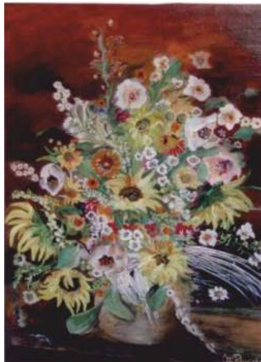
BARWA I FAKTURA W KOMPOZYCJI KWIATOWEJ