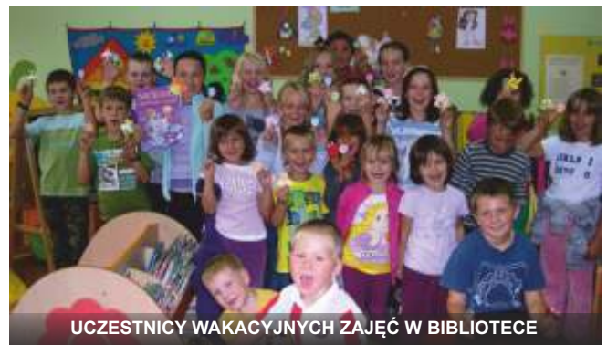
UCZESTNICY WAKACYJNYCH ZAJĘĆ W BIBLIOTECE

Wszystkie proponowane przez bibliotekę formy spędzenia wolnego czasu cieszyły się dużym zainteresowaniem, zwłaszcza że tylko biblioteka zorganizowała wakacyjne zajęcia dla dzieci.