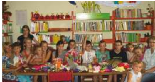
ROBIMY KWIATY Z BIBUŁY I KREPINY

Dużym zainteresowaniem cieszyło się kino letnie w świetlicy środowiskowej. Filmy i bajki były wyświetlane w godzinach wieczornych.