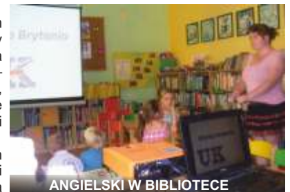
ANGIELSKI W BIBLIOTECE

Na zakończenie letnich spotkań bibliotecznych dzieci przygotowały pyszną owocową sałatkę, którą mogli skosztować pracownicy biblioteki, jak i urzędu gminy.