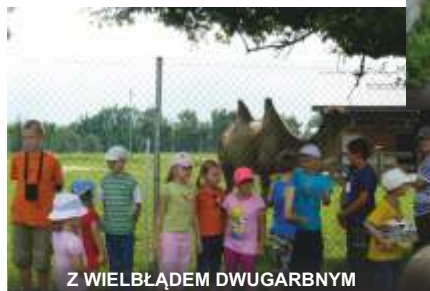
Z WIELBŁADEM DWUGARBNYM