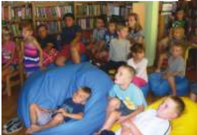
MAŁE KINO W BIBLIOTECE

Od poniedziałku do piątku dzieci mogły korzystać z Kącika Malucha, gdzie czekały na nie gry planszowe, kolorowanki, zabawki edukacyjne. We wtorki w ramach „Małego kina w bibliotece”, przygotowaliśmy dla dzieci bajkowe seanse, podczas których wraz z ulubionymi postaciami z filmów animowanych mogły spędzić miło czas.