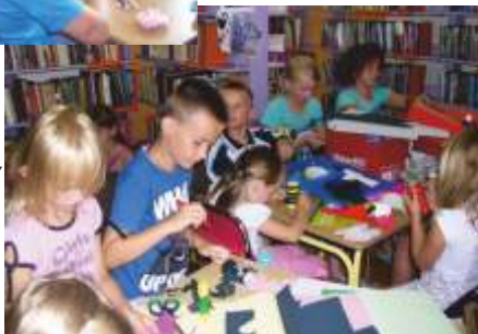
DZIECI PODCZAS PRACY NAD KOLOROWYMI OWADAMI

biułę, niepotrzebne gazety - świetnie się przy tym bawiąc. Z pustych słoików i skrawków bibuły powstały kolorowe wazoniki, a z chusteczek higienicznych dzieci wyczarowały prześliczne goździki, które je zapełniły. Z rolek po papierze toaletowym i ręcznikach jednorazowych dzieci stworzyły: latające motyle, pszczołki, nietoperze, a także pojemniki na kredki czy długopisy. Z nakrętek po napojach powstały kolorowe kwiaty, a z samych plastikowych butelek i papieru samoprzylepnego kolorowe „świnki recyklinki”,