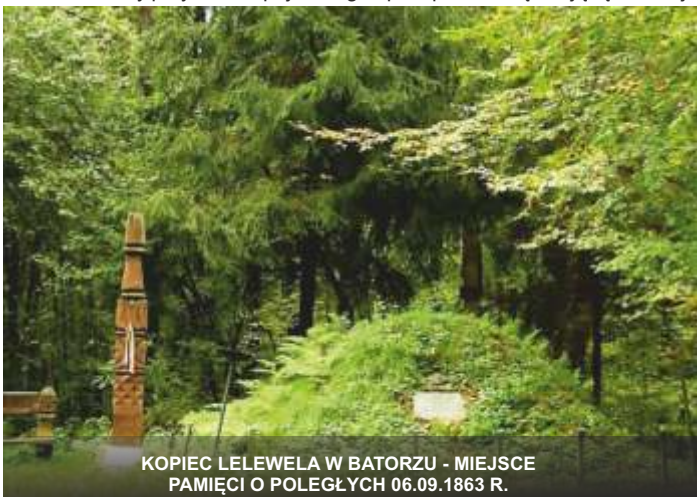
KOPIEC LELEWELA W BATORZU - MIEJSCE PAMIĘCI O POLEGŁYCH 06.09.1863 R.