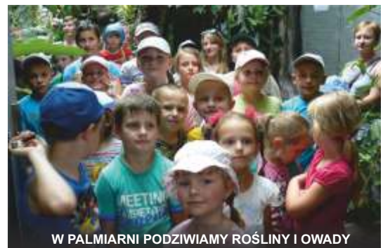
W PALMIARNI PODZIWIAMY ROŚLINY I OWADY