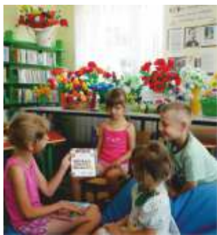
WAKACYJNE ZABAWY W BIBLIOTECE