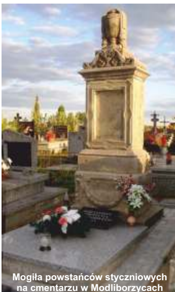
Mogiła powstańców styczniowych na cmentarzu w Modliborzycach

Jednocześnie zapraszamy wszystkich chętnych do współpracy przy redagowaniu kwartalnika „Wieści Gminne”. Dzięki Waszym pomysłom nasza gazeta może być ciekawsza.