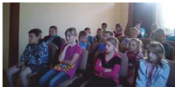
LETNIE KINO W BIBLIOTECE