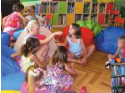
ZABAWY W KĄCIKU MALUCHA

Tegoroczne wakacje w gminnej bibliotece przebiegały pod hasłem: "KSIĄŻKA, UŚMIECH I SŁOŃCE W WAKACYJNE MIESIĄCE" . Naszych czytelników zaprosiliśmy na dwa miesiące dobrej zabawy. W sumie w naszej bibliotece odbyło się 21 spotkań, w których średnio uczestniczyła 25-osobowa grupa dzieci w wieku od 3 do 15 lat. Spotkania były wypełnione różnymi formami zabawy, bo przecież w bibliotece może być kolorowo, wesoło i tak trochę inaczej.