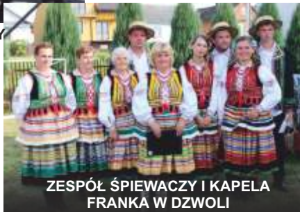
ZESPÓŁ ŚPIEWACZY I KAPELA FRANKA W DZWOLI